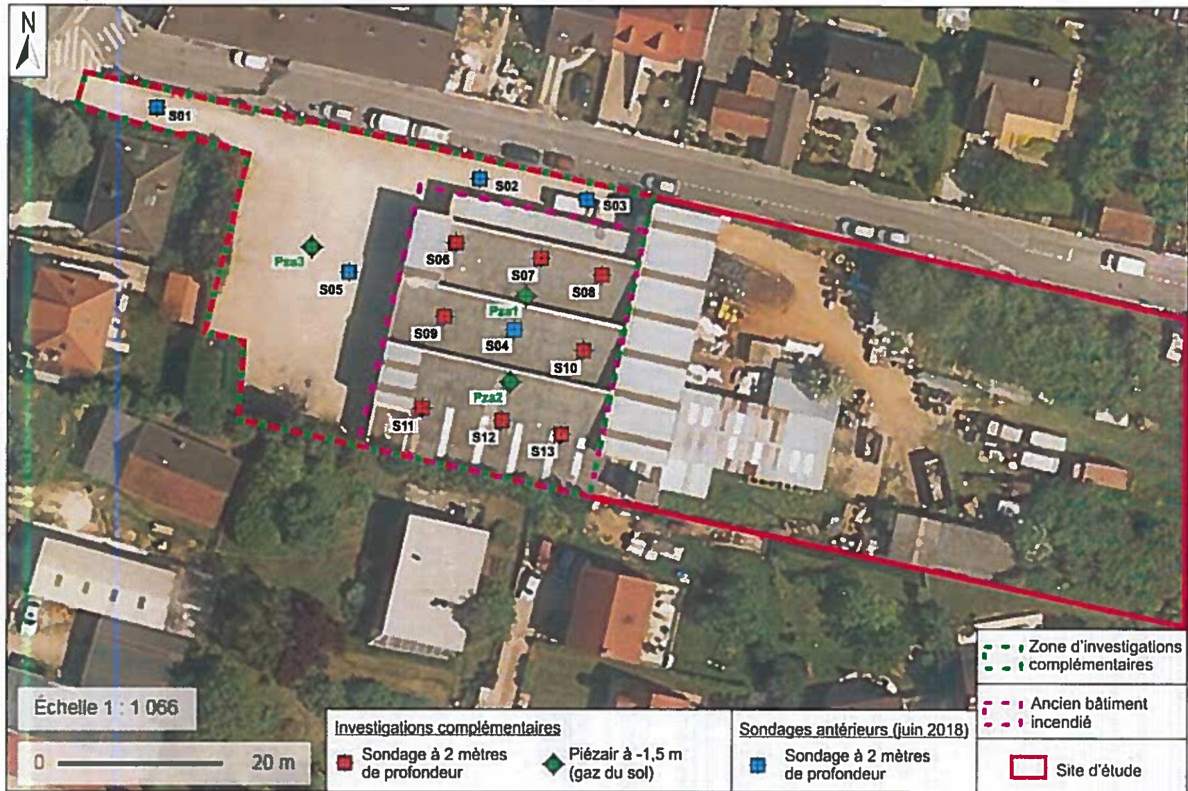
Figure 2 : plan de localisation des investigations réalisées en zone Ouest